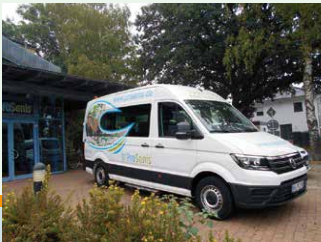
Unsere behindertengerechten Busse holen und bringen Sie sicher nach Hause.

Die Einrichtung und unsere Mitarbeiter sind von Montag bis Freitag in der Zeit von 7 bis 19 Uhr für Sie da.